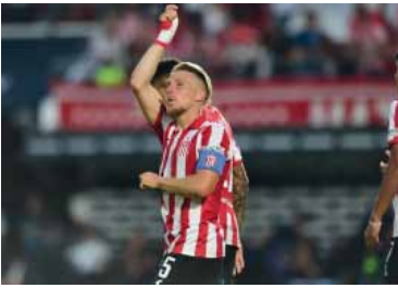
Objetivo. El "Ruso", protagonista del mercado de pases.

campista. Esto podría hacer más atractiva la propuesta para Estudiantes, aunque el "Pincha" busca retener a su capitán o, en su defecto, que su destino sea Europa, donde podría dar un salto importante. Las primeras reuniones dejaron las puertas abiertas, pero el contexto deportivo podría cambiar la negociación. Estudiantes está enfocado en la final del Clausura ante Racing; un título podría modificar los planes y fortalecer la intención de retener a Ascacíbar para la próxima Copa Libertadores. River sabe que no será fácil: convencer Juan Sebastián Verón implicará un esfuerzo económico adicional, tanto en el pase como en el