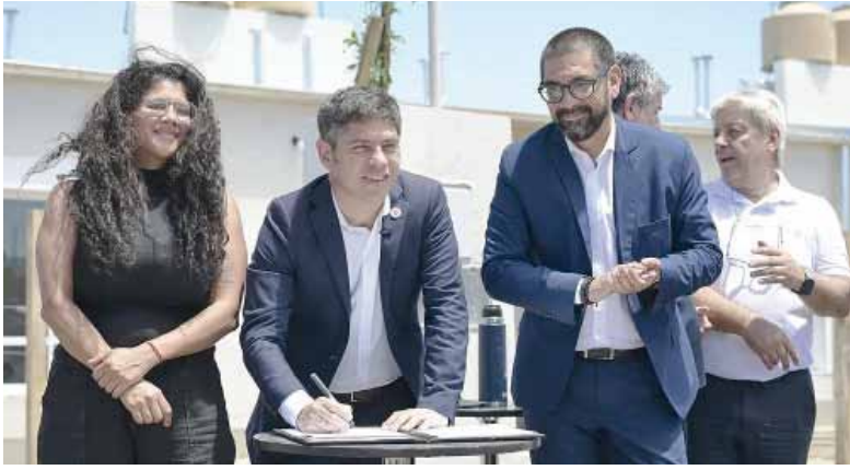
Firma. Kicillof entregó viviendas en Bahía Blanca.

El gobernador bonaerense observó las obras del acueducto que integran el plan hídrico para mejorar el servicio de agua potable.