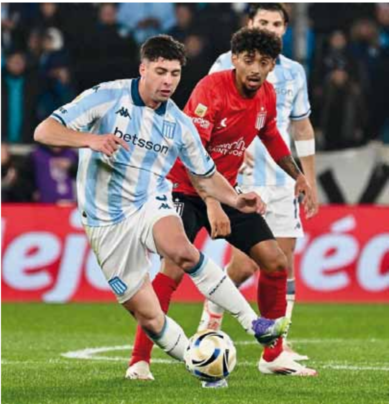
Tensión. Será un duelo áspero y reñido en busca del cetro.

Palmarés Si Racing obtiene el título, alcanzará su 19° campeonato de Liga, sumándose a los logros en 1913, 1914, 1915, 1916, 1917, 1918, 1919, 1921, 1925, 1949, 1950, 1951, 1958, 1961, 1966, 2001, 2014 y 2019. Estudiantes,