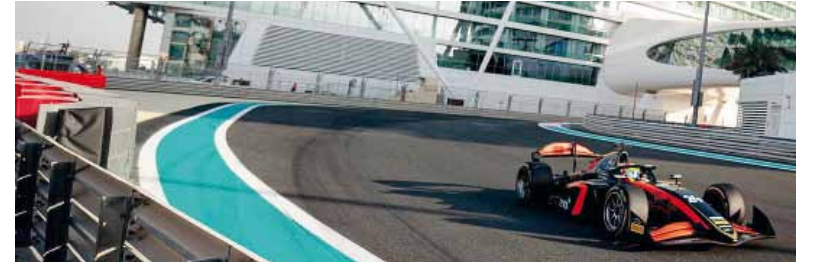
Adaptación. Primera experiencia con el Van Amersfoort Racing.

Acumuló más de 1.500 km y giró 286 veces en tres días de pruebas en el circuito Yas Marina.