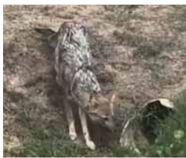
Los zorros fueron captados por las cámaras de seguridad de los barrios.

Tal como ocurre desde hace varios meses con la presencia de pumas, la situación alarma a los habitantes de los barrios porque desconocen los hábitos de esta especie, que no está acostumbrada a