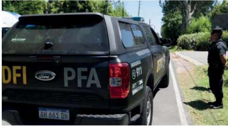
Revisión. El allanamiento duró toda la mañana.