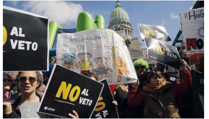
Manifestación. De padres de niños con capacidades diferentes.

La ley había sido aprobada por el Congreso en julio del año pasado y declaraba la emergencia en materia de discapacidad hasta fines de