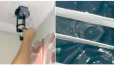
Espiaba a estudiantes.