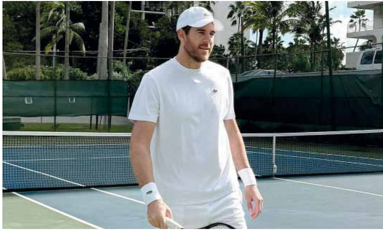
Inoxidable. El tandilense prepara su vuelta a los courts.

El torneo guarda un significado especial para el tandilense: fue allí donde levantó su primer título tras una lesión en 2011, marcando su regreso triunfal al circuito. Además, regresó cuatro años más tarde y disputó su última participación en 2019, cuando ocupaba el cuarto puesto del ranking mundial. Con 14 victorias en Delray Beach, comparte el sexto lugar histórico en la lista de triunfos del certamen, consolidando su vínculo con esta cita que combina historia y emociones.