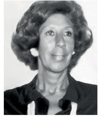
La envenenadora Yiya Murano.

Se vendió el juego de té que usaba Yiya Murano