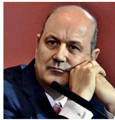
El ministro de Desregulación y Transformación del Estado, Federico Sturzenegger.

idea del banco de horas, que permite compensar tiempo trabajado en días posteriores sin modificar la existencia de horas extra tradicionales: "Si te quedás dos horas un día, el empleador puede darte libre el viernes a la mañana". - DIB -