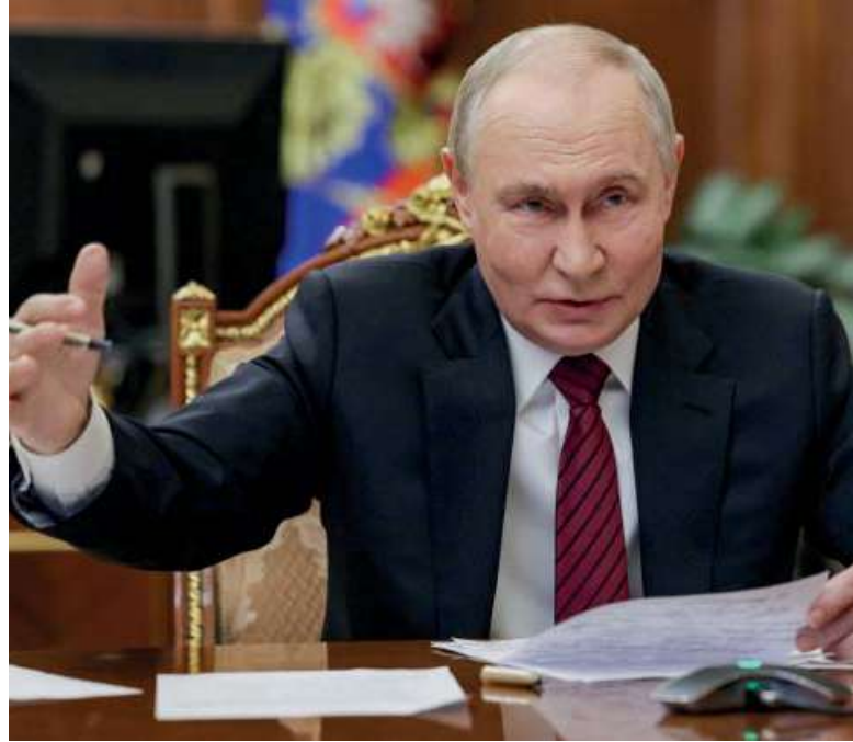
Firmeza. Putin se mantiene en su posición con respecto a las regiones anexadas.

tadounidense afirmó que la región del Donbás tendrá que ser "dividida" para poner fin a la guerra.