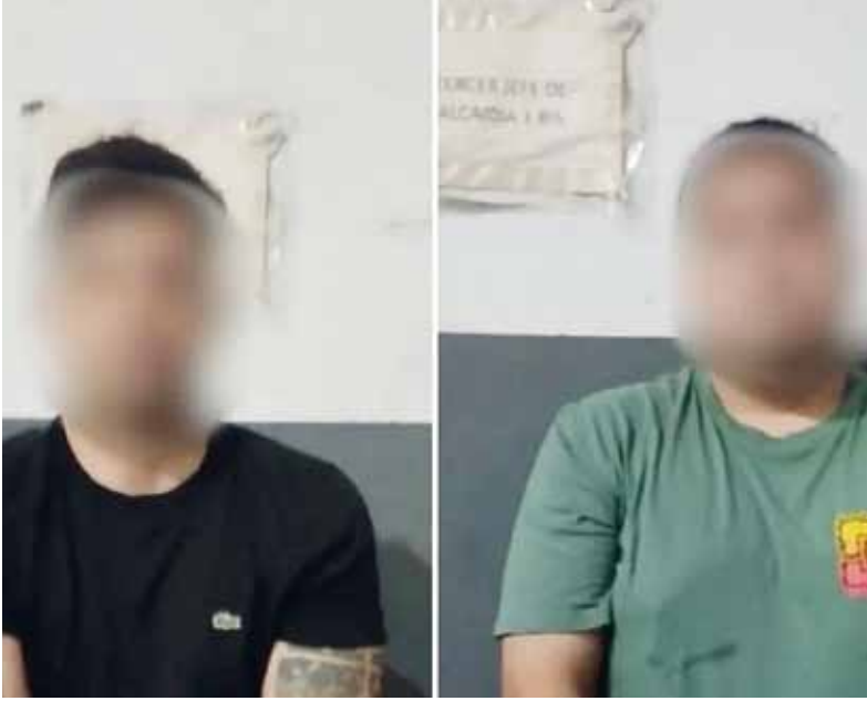
Por intento de coima. Dos individuos fueron detenidos.

■ Dos hombres que están detenidos por intentar coimear a policías durante un control recibieron prisión preventiva tras una solicitud por parte del Auxiliar Fiscal Carlos Caputto, de la Unidad de Flagrancia Este (UFLA) del Ministerio Público Fiscal de la Ciudad. El hecho ocurrió en la calle Salta al 1400 cuando dos efectivos de la Comisaría 1C de la Policía de la Ciudad realizaban un recorrido preventivo por el barrio de Constitución y observaron detenida, con motor en marcha y con las luces prendidas, una camioneta Dodge Ram con dos ocupantes en su interior. Al lado del rodado se encontraba una tercera persona realizando un pasamanos. Frente a la extraña situación, típica de la venta de droga, los efectivos solicitaron a los ocupantes, de 28 y 30 años, que descendieran para su correcta identificación, momento en el que uno de ellos intentó coimearlos, según informaron desde el Ministerio Público Fiscal porteño a la Agencia Noticias Argentinas. “Oficial, tenemos drogas, ma-