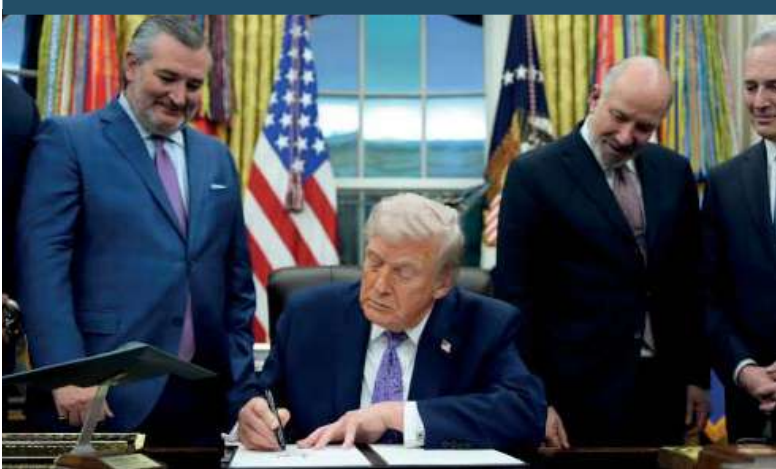
El presidente de Estados Unidos, Donald Trump, firmó una orden ejecutiva para emitir un marco regulatorio nacional para la IA, limitando así el poder de los estados.

"Para obtener el éxito, las empresas estadounidenses de IA deben tener la libertad de innovar sin una regulación engorrosa. Sin embargo, la excesiva regulación estatal frustra este imperativo", dice la orden.