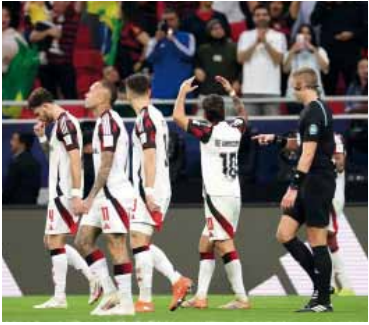
El "Mengao" busca otra coronación

Flamengo va por la final de la Intercontinental