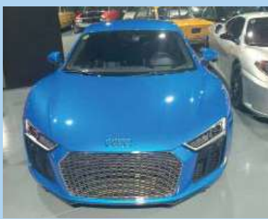
Un Audi R8 5.2 Plus Quattro 2018 hallado en la casa.

Un total de 54 vehículos -45 autos de lujo o colección, 7 motocicletas de alta cilindrada y dos kartings- fueron secuestrados por la Justicia en el allanamiento de la mansión en Villa Rosa, Pilar. Los vehículos están en un galpón de grandes dimensiones y todos figuran como de propiedad de la firma "Real Central SRL", informaron a Infobae fuentes judiciales. Entre los autos encontrados, hay varios Porsche, un Audi, un BMW, motos Harley Davidson y una Ferrari F430 coupe. Otros vehículos de colección fueron identificados con su número de patente y los investigadores aún estaban intentando establecer