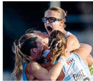
Animadas. La Selección va por otra alegría.

La final propone mucho más que una copa: es la oportunidad